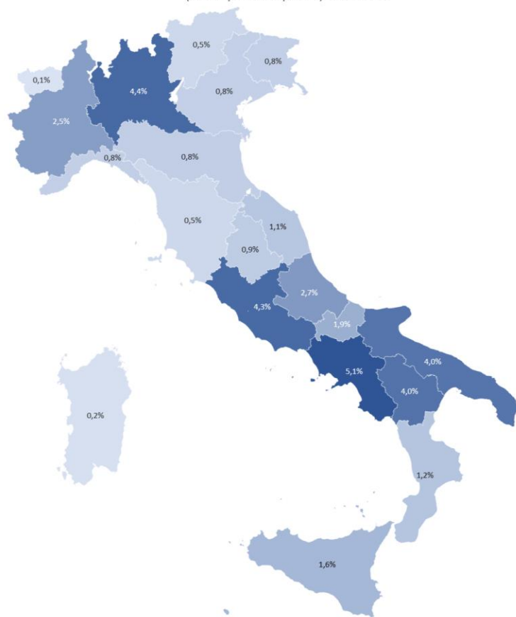
Incidenza regionale lavoratori coinvolti (in % dipendenti privati) - FNC 2021