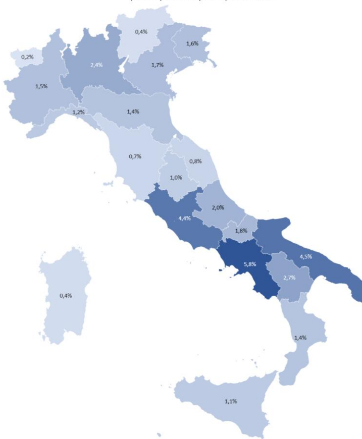
Incidenza regionale lavoratori coinvolti (in % dipendenti privati) - FNC 2022